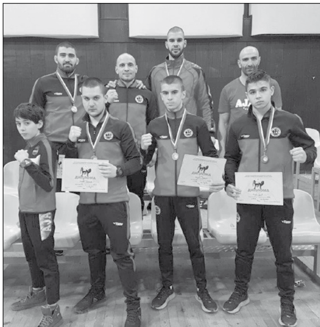
СК „Аякс“ е един от водещите в страната