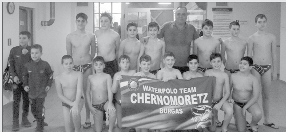
„Черноморец“ постигна поредна победа

в Меден рудник ще се проведе квалификационният турнир за Държавното първенство U15. Десет отбора, разпределени в две групи, ще спорят за първите места. В група „Б“ са домакините „Нептун“, ЦСКА, „Локомотив НН“, „Ботев 2000“ и „КПС Варна“. В група „В“ са домакините „Черноморец“, „Аква Спорт“, „Арда 2008“, „Локомотив“ /Рс/ и „Комодор“.