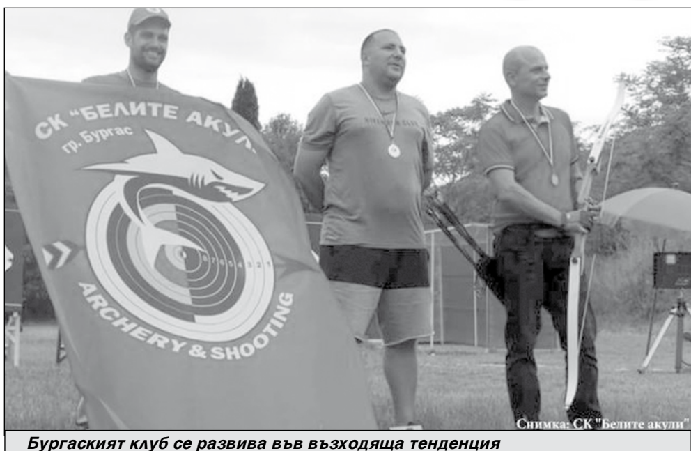
Бургаският клуб се развива във възходяща тенденция

Това е спорт, който ще се развива в града